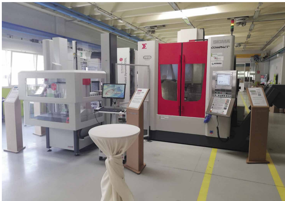
► Le robot Erowa dessert tout le pôle usinage de l'atelier, soit 6 équipements, des machines au centre de mesure

Depuis le lancement d'Erowa ProductionLine 4.0, de nombreuses applications en France et en Europe illustrent la maturité de l'environnement Erowa 4.0. C'est le cas de l'atelier-vitrine 4.0 présenté par douze grandes entreprises à Ivrea (Italie). La diversité des machines et robots, gérée par le superviseur Erowa, préfigure le modèle hautement automatisé, évolutif et parfaitement transposable pour le secteur aéronautique.