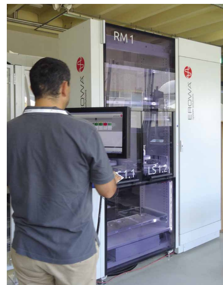
► Tous les trimestres, trois à quatre fonctionnalités nouvelles enrichissent la bibliothèque de logiciels « Erowa factory 4.0 »

Au-delà du produit choisi, l'atelier a démontré sa très grande flexibilité aux contraintes de disponibilité imposées pour tester chaque